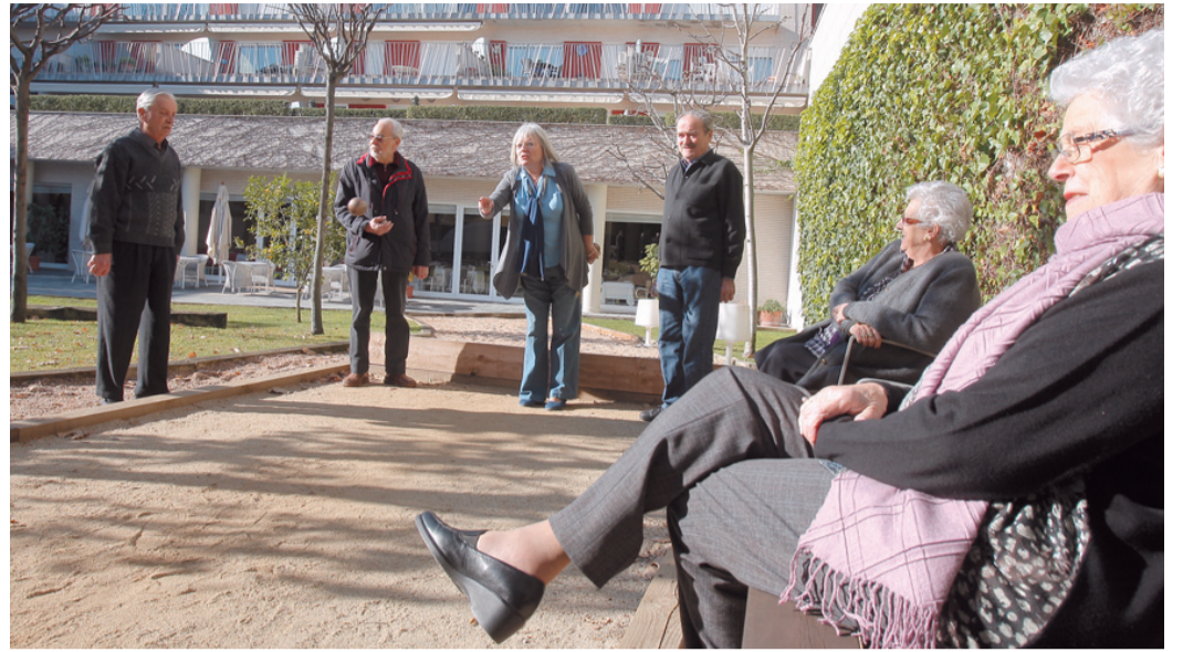
La pista de petanca, en un racó del jardí.

La ubicació dels 103 pisos, a només 10 minuts de la Plaça Vella, és ideal per reforçar el sentiment d'independència dels residents, que entren i surten a plaer. Una directora vetlla pel funcionament del centre i el bon ús dels espais comuns i supervisa la feina dels professionals ▶